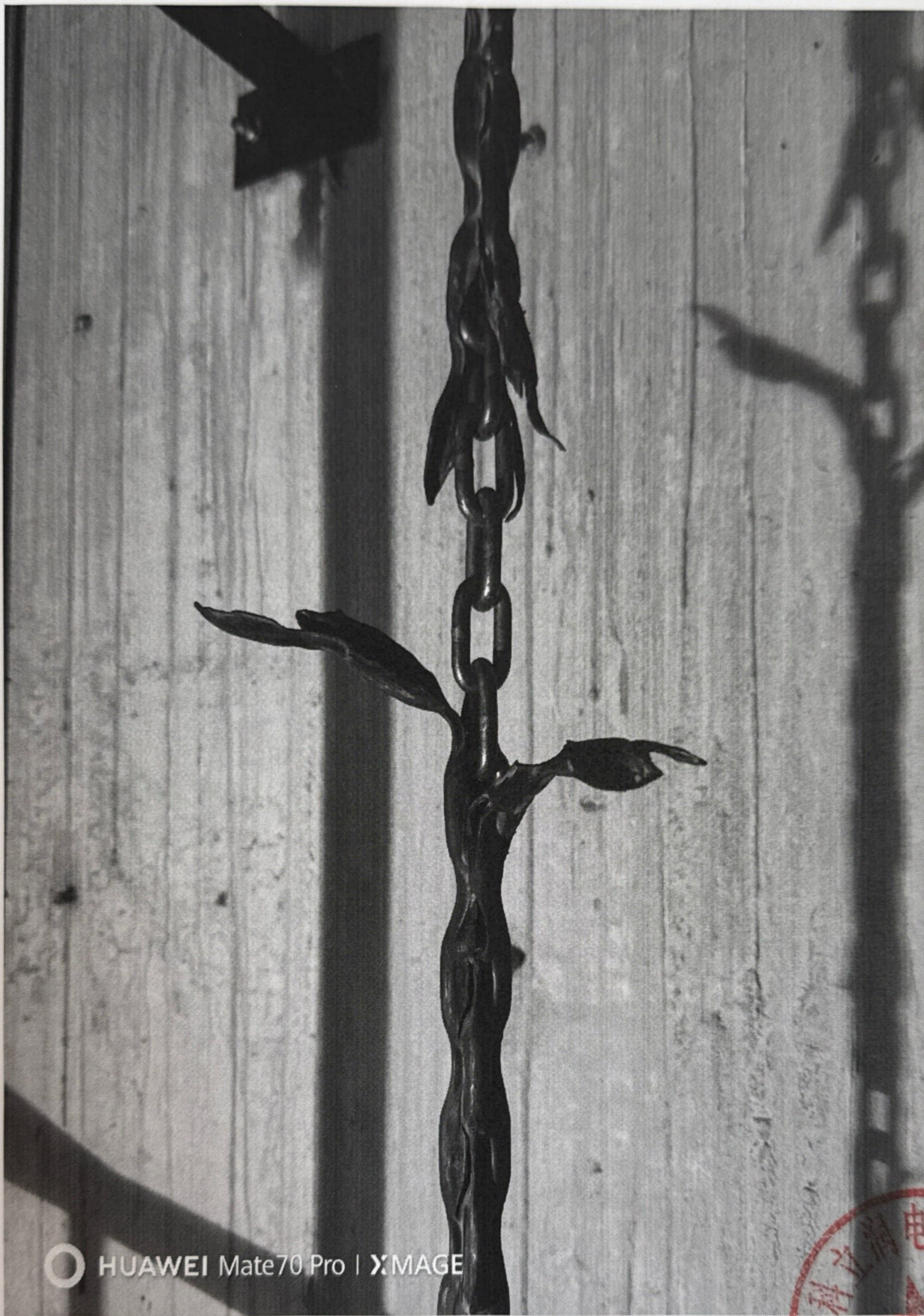
补偿缆表面包裹材料出现脱落、严重开裂破损